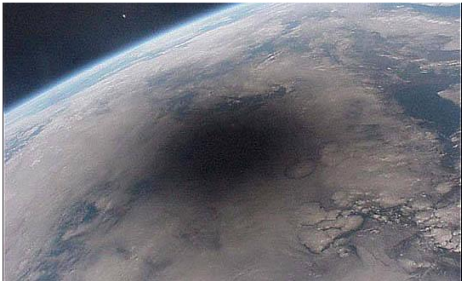
Fotografía de la sombra de la luna sobre la superficie de la Tierra durante un eclipse solar, tomada el 8 de abril de 2014.

Una sombra o silueta es un área de oscuridad donde la luz está bloqueada por un objeto opaco. Cuando bloqueas el brillo que emite una fuente de luz (por ejemplo, el sol o una linterna) con un objeto, se forma una silueta o sombra atrás de él. Las nubes forman grandes siluetas que bloquean la luz y el calor producido por el sol, manteniéndonos frescos y protegidos del calor del día.